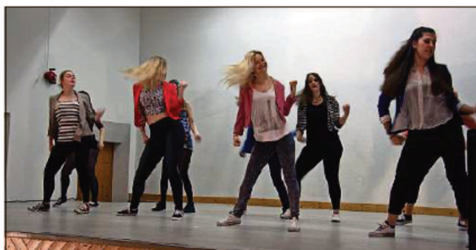
Seit zehn Jahren gibt es in Bonaduz ein Tanzangebot für Oberstufenschüler.